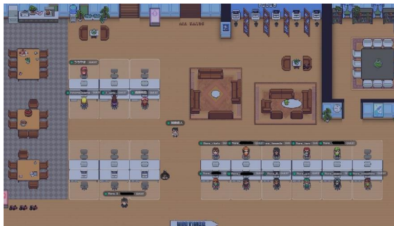
▲同じオフィスで働いている環境を仮想空間で再現